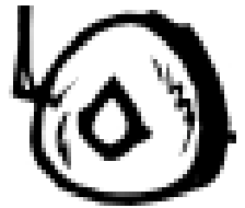
හුලං නැති රෝදයක් විශ්වාසය නැතිකම

විශ්වාස ලක්ෂණය, කිසිම පොතකින් නෙමේ අපිට ආවේ දැන් අපේ පොත්වල තිබුණාට මෙම යාවිඤ්ඤාව, සුවිශේෂකවරු හතර දෙනා පොත් ලියන තෙක් මුදුණා තාක්ෂණය එනතෙක් මේ ආගමේ සිද්ධාන්ත, සාමාන්‍ය මිනිසුන්ට වන අපට පරම්පරාවෙන් පරම්පරාවට අපට කියා දුන්නේ මේ යාවිඤ්ඤාවෙනි. මේ යාවිඤ්ඤාවෙන් අපි කොහොමද අපේ දෙවියන් වහන්සේව විශ්වාස කරන්නේ කියලා කොටස් දොළහකින් බොහෝම සරලව මතක් කර දෙනවා. ඉතින් මින්පසු විශ්වාස ලක්ෂණය කියද්දී මේ කොටස් 12න් කියන්නේ මොනවද කියලා හැම මොහොතකම මතක් කරගන්න ඕනා. දැන් අපි කටපාඩමෙන් මේ යාවිඤ්ඤාව දන්න නිසා එය උච්චාරනය කරද්දී නිකම් සතෙක් කැරගෙනවා වගේ නැතුව හොඳ අවබෝධයකින් හක්නියකින් කියන්න ඕනේ. මේ සරල කරුණු 12 හොඳට මතක් කර ගන්න ඕනේ. නැත්නම් අපගේ විශ්වාසය නැති වී යනවා. මගේ කාර් එකේ එක රෝදයක හුලං බිහිනවා.