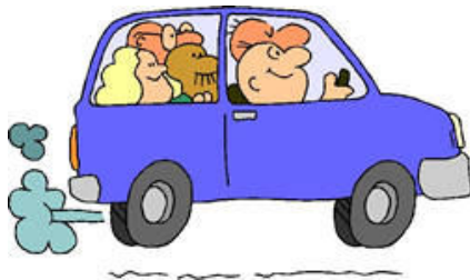
මගේ කාර් එක