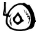
දෙවියන්ට වන්දනා කරන්න දැන්නේ නැතිකම.

අපි දැන් දන්නවා මෙය සකුමේන්තු 7කින් සමන්විත මෙය කොටස් 3කින් අපට තේරුම් ගන්න පුළුවන්. අපි කතෝලිකයෙකු වීමට ප්‍රසාද ස්නාපනය, අභිවෘද්ධි අලේපය තුළින් අපි අපේ ආගමේ ළදරුවෙක් හා වැඩිහිටියෙකු වෙනවා. දිව්‍ය සන්ප්‍රසාදය තුළින් අපි අපේ ආගමෙන් දෙවියන්ගෙන් ශක්තිය ලබා ගන්නවා ජීවිතය සන්තෝෂයෙන් ගෙවන්න.